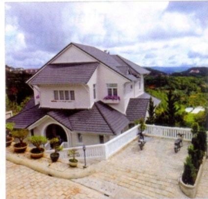
Vị thế khá đặc địa, quang cảnh độc đáo tạo nên giá trị tăng thêm cho dự án biệt thự.